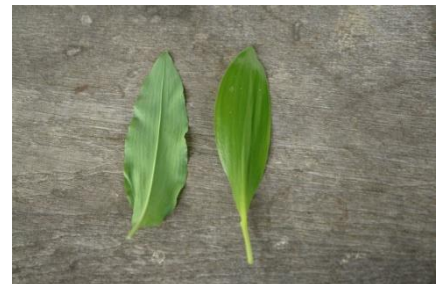
Bärlauch - Maiglöckchen