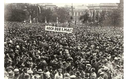
Mai-Aufmarsch am Wiener Rathaus-Platz im Jahr 1925

Am 1. Mai gibt es meistens Märsche, Feiern und Ansprachen von Politiker*innen zum Thema Arbeit.