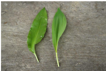
Bärlauch - Maiglöckchen