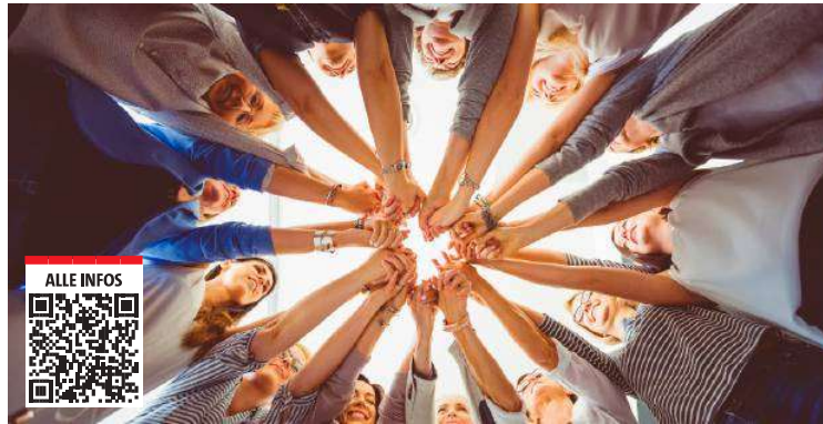
Beim Kongress am 6. Oktober geht man auch der Frage nach, warum die Wirtschaft Frauen an der Spitze braucht.

mit der Teilnahme am Kongress eine Form der Wertschätzung entgegenbringen“.