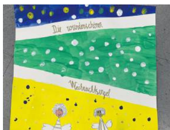
Motiv 2: „Weihnachtsengel“ von Kitty Aileen Smonjak