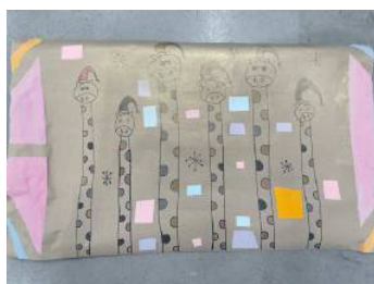
Motiv 5: „Weihnachtsgiraffen“ von Sandra Wieser