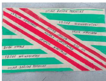
Motiv 4: „Vrolijk Kerstfeest og God Jul“ von Bernd Poschinger